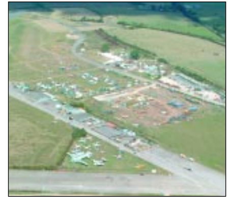
Long Marston, ahogy Aurél látta

következtetésre jutott: a motoros sárkány adja a legnagyobb szabadságot. 1996-ban már önállóan repült saját Trabant-motoros gépével – már azt is egyfajta eredménynek tekintette, ha egyáltalán el tudott indulni. Felderítés céljából – ekkor még versenyen kívül – körülnézett az az évi miskolci BAZUL Kupán is.