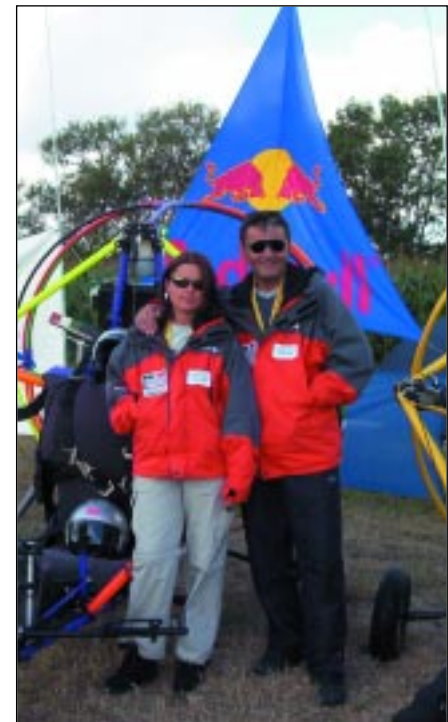
A Szilágyi duó

ahogy az ég egy termékszámában tele volt szebbnél szebb ernyőkkel, és élvezhettük a verseny utáni "levezető" wingovereket, méghozzá az igazi profiktól.