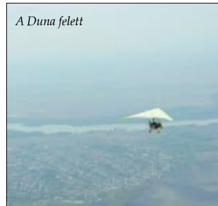
A Duna felett