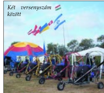
Két versenyszám között