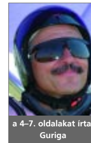
a 4-7. oldalakat írta: Guriga

A tárgyalás kb. egy órát tartott, a bírónő a tényállás meghallgatása és néhány kérdés feltétele után kihirdette az ítéletet, amely jogerős és nem fellebbezhető. Ennek értelmében az eljárást megszüntette, mert jelenleg jogszabály nem írja elő a siklórepülő